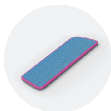
Ганчірка для швабри QSSPRAYMOP