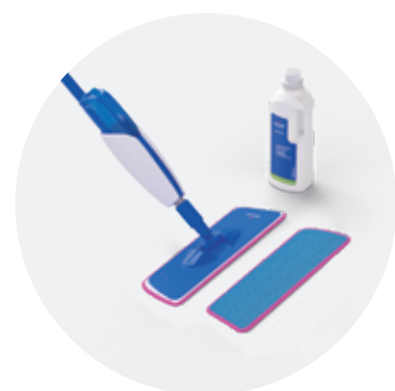
Комплект для догляду QSSPRAYKIT