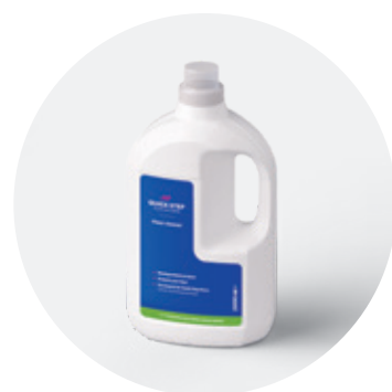
Засіб для миття підлоги 1 л або 2 л QSCLEANECO1000 QSCLEANECO2000