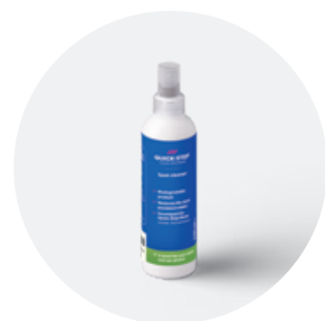
Засіб для чищення плям 250 мл QSSPOTCLEAN